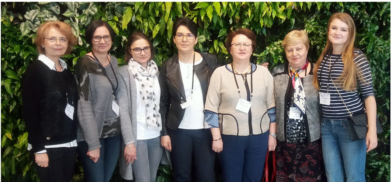
Polacy uczestnicy 11. Międzynarodowego Kongresu Andrologicznego w Kopenhadze